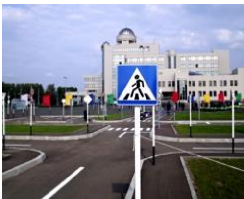
Фрагмент обустройства автогородка

Детский автогородок помогает детям осваивать правила дорожного движения. Здесь все как на настоящей автомобильной дороге – дорожные знаки, пешеходные переходы и дорожная разметка.