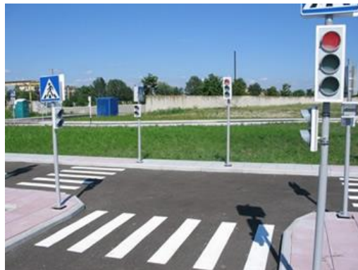
Участок автоплощадки с разметкой и светофором

На площадке белой и желтой красками наносятся линии разметки, устанавливаются дорожные знаки, на перекрестках светофоры (стационарные или переносные). К стационарным светофорам подводится питание от электросети, переносные светофоры работают от аккумуляторов или батареек.