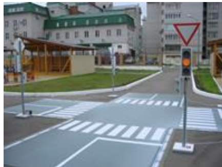
Общий вид мобильного учебного площадки

Учебная мобильная площадка представляет собой имитацию дорожного перекрестка со светофорами, дорожными знаками и разметкой.