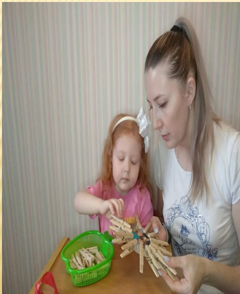
Оформление семейной фотографии