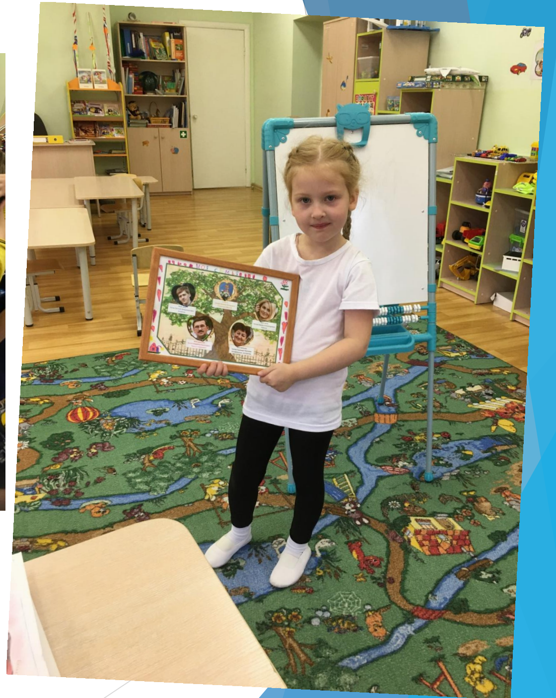
«Профессии в моей семье»